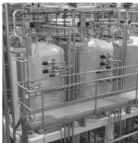
Unité d'échange d'ion pour l'industrie laitière

Electrodialyse, évaporation et cristallisation