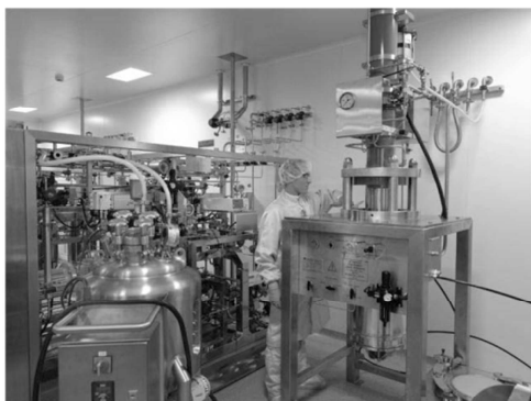
Service de purification à façon - Colonne Prochrom® LC300

Des solutions pour les industries biopharmaceutiques, agro-alimentaire et de biotechnologies